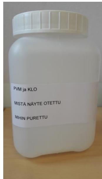
Kuva 4. Näytepullon merkitseminen.

BOHAN laboratorio: Mirka Lindfors puh: 050 395 7213