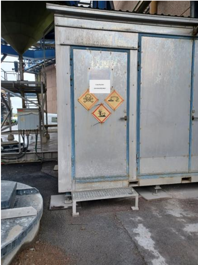
Kuva 2. Rikkihappotehtailla sijaitseva kontti, ovesa lukee vuosihuollon pesuvesinäytteet.