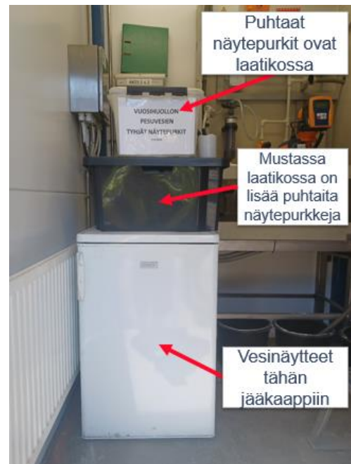
Kuva 3. Näyteastioiden haku- ja palautuspaikka kontissa.