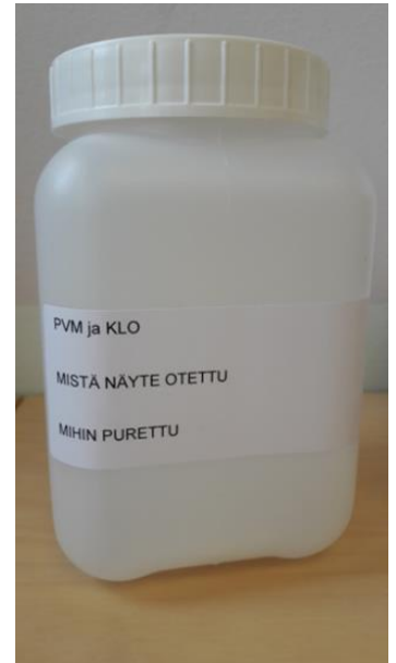
Kuva 4. Näytepullon merkitseminen.

BOHAn laboratorio: Mirka Lindfors puh: 050 395 7213